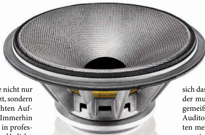
◀ Der sickenlose Mitteltöner, hier allerdings mit dem neuen „Continuum“-Material, ist ein Filetstück der Konzeption.

ionen darüber zu, ob B&W die nicht nur zur soliden Verschraubung nutzt, sondern gegebenenfalls auch zum leichten Auf-rüsten mit Aktivtechnologie. Immerhin sind B&W-Lautsprecher auch in professionellen Studios wie Abbey Road beliebt, und diese mögen – eigentlich – bevorzugt aktive Lautsprecher. Und natürlich stellten wir diese Frage, als uns die Serie im vergangenen Jahr präsentiert wurde – ernteten aber nichts als ein verschmitztes Lächeln. Wir sind gespannt.