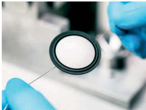
◀ Hier wird die Hochtonkalotte aus reinem Diamant für die Montage vorbereitet.