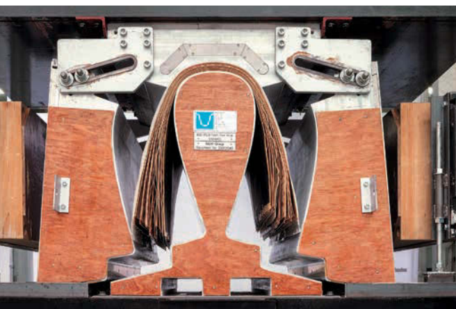
◀ So sieht es aus, wenn mehrlagige Schichten zu einem abgerundeten Gehäuse geformt werden – das ist übrigens sehr teuer, weshalb es nur wenige tun.

Zumindest habe ich so noch von keiner B&W einen großen Flügel gehört. Ungeheim flüssig, agil, mit völlig glaubhaften Dimensionen sowie extremer Beweglichkeit in den mittleren Lagen projiziert sie das Instrument dreidimensional in den Raum. Mit ungewöhnlich feiner Auflösung und einem rhythmischen Timing der Extraklasse gesegnet, musiziert die Britin zudem los, dass es einem buchstäblich den Atem verschlägt. Dieser Lautsprecher swingt, er geht auch mit Blues Company oder gar AC/DCs „Thunderstruck“ regelrecht ab, mit superb federndem Bass! Man fragt sich ob dieser lebendig-dynamischen,