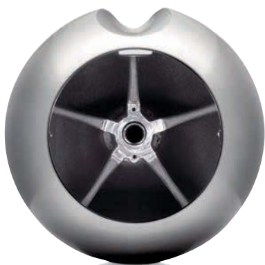
▲ Der Hochtöner bildet mit der akustisch optimierten und entkoppelten Aluminiumröhre eine Einheit.

Mit 17.000 Euro Paarpreis kein Pappenstiel oder gar ein Volkslautsprecher, vereint sie jedenfalls praktisch alle Qualitäten, die heute bei Lautsprechern der höchsten Güteklasse machbar sind,