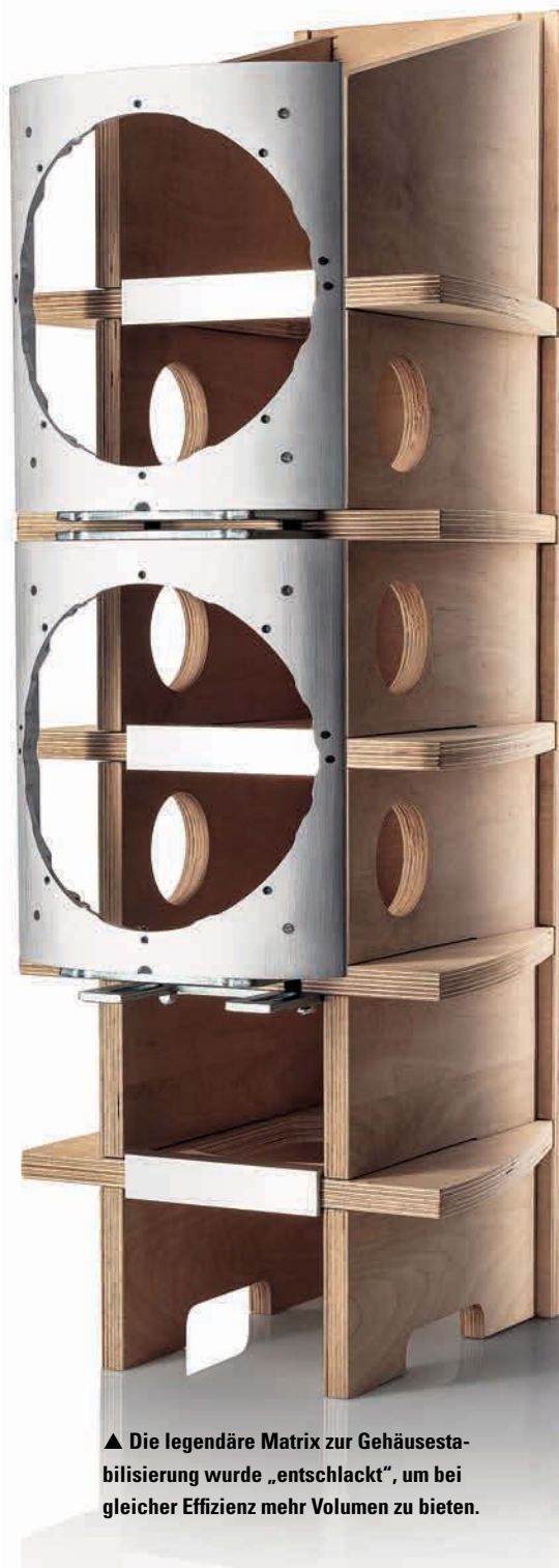
▲ Die legendäre Matrix zur Gehäusestabilisierung wurde „entschlackt“, um bei gleicher Effizienz mehr Volumen zu bieten.

Selbstverständlich lässt die kühlkörperartige Aluminium-Rückwand Spekulat-