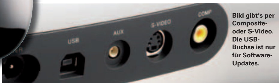
Bild gibt's per Composite- oder S-Video. Die USB-Buchse ist nur für Software-Updates.

Die eiförmige Fernbedienung liegt gut in der Hand, wegen der symmetrischen Form aber nicht immer richtig herum.